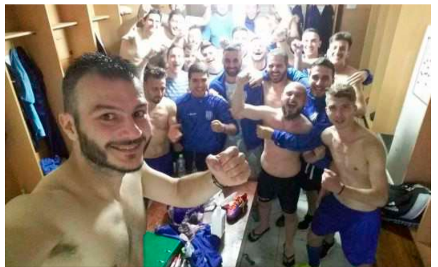
Πανηγύρια και χαρές στα αποδυτήρια από τους παίκτες της ομάδας μας μετά το νικηφόρο 2 -0 επί του Απόλλωνα Λιτοχώρου στον αγώνα μπαράζ.

για την ηθική-υλική και οικονομική στήριξή του, καθώς και όλους τους φίλους της ομάδας, μικρούς και μεγάλους που ήταν κοντά στην ομάδα μας καθ' όλη την διάρκεια του έτους. Το Δ.Σ. του Συλλόγου ευελπιστεί στη νέα χρονιά η στήριξη όλων προς την ομάδα μας να είναι ακόμη μεγαλύτερη.