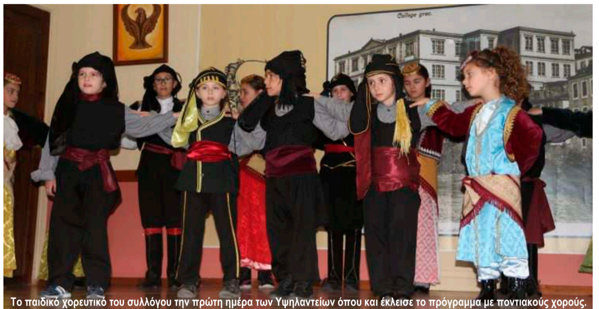
Το παιδικό χορευτικό του συλλόγου την πρώτη ημέρα των Υψηλάντειων όπου και έκλεισε το πρόγραμμα με ποντιακούς χορούς.

Με μεγάλη επιτυχία πραγματοποιήθηκαν για μία ακόμη χρονιά οι καθιερωμένες εκδηλώσεις των «ΥΨΗΛΑΝΤΕΙΩΝ» που διοργανώθηκαν με πρωτοβουλία του συλλόγου μας του «Αλέξανδρου Υψηλάντη» και την συνεργασία των φορέων της Νέας Τραπεζούντας.