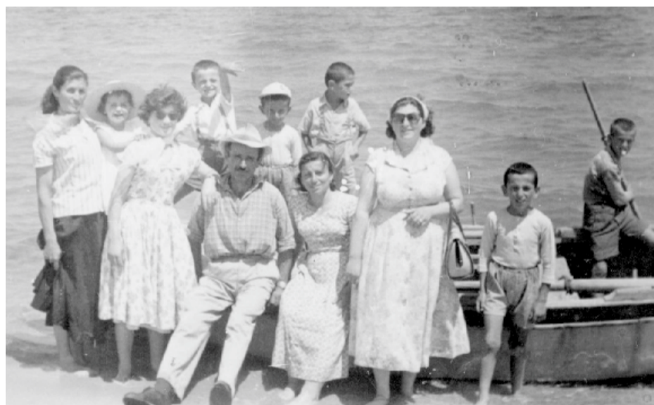
Οικογενειακή εκδρομή με συγγενείς στην θάλασσα του 1958, Παραλία Κατερίνης.