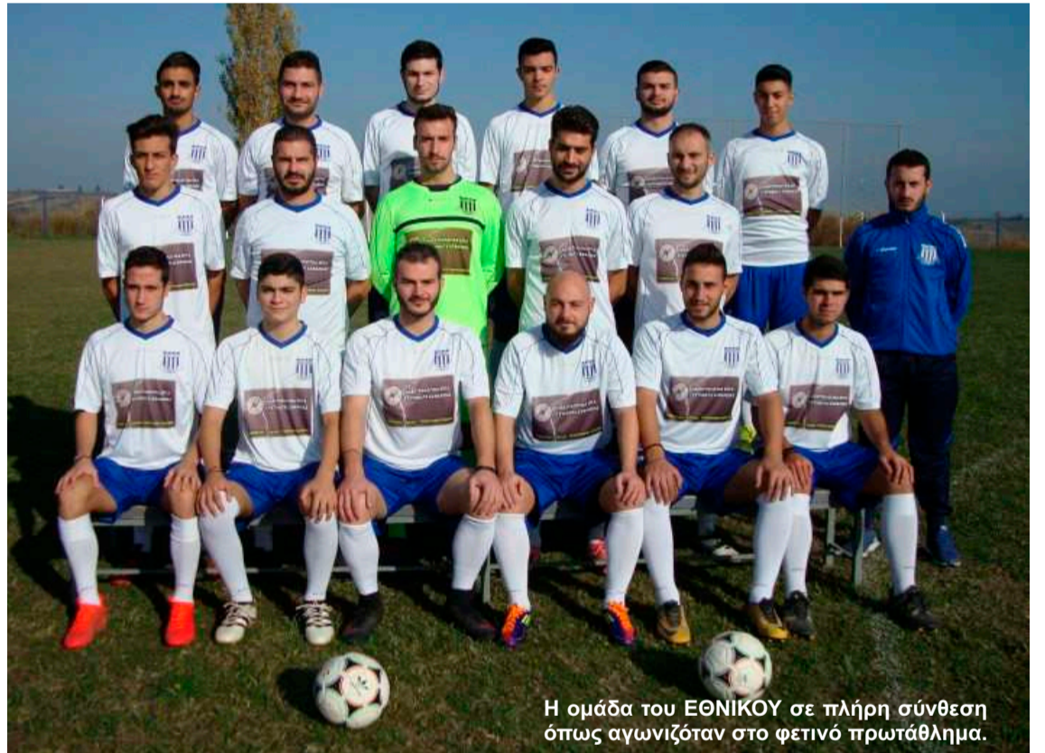
Η ομάδα του ΕΘΝΙΚΟΥ σε πλήρη σύνθεση όπως αγωνιζόταν στο φετινό πρωτάθλημα.