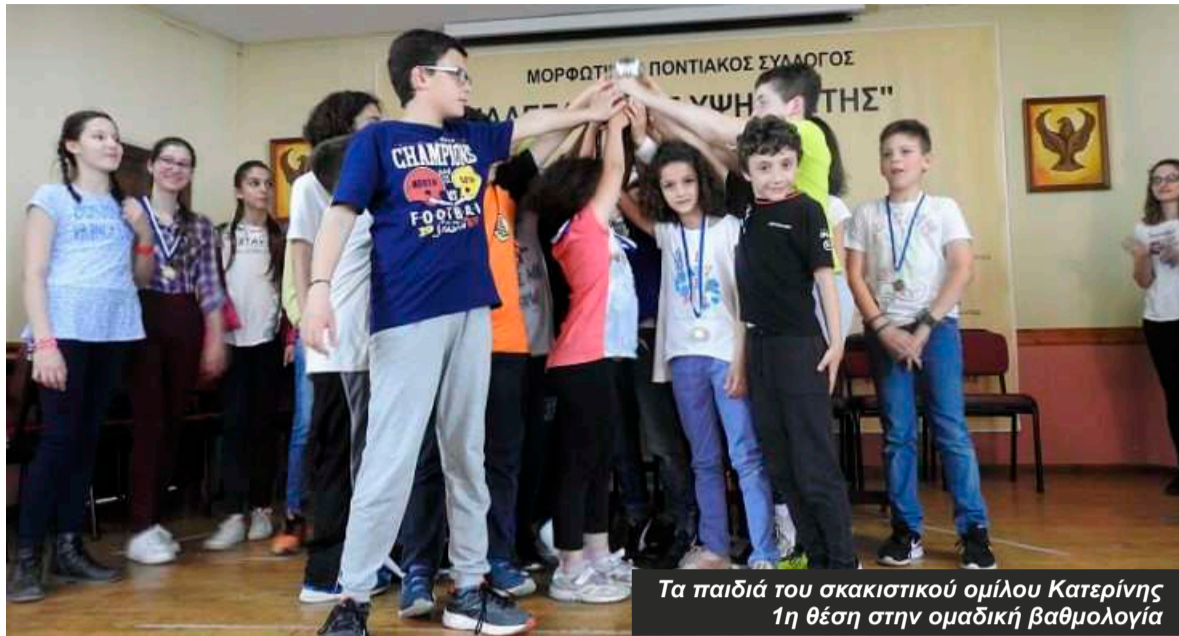
Τα παιδιά του σκακιστικού ομίλου Κατερίνης 1η θέση στην ομαδική βαθμολογία